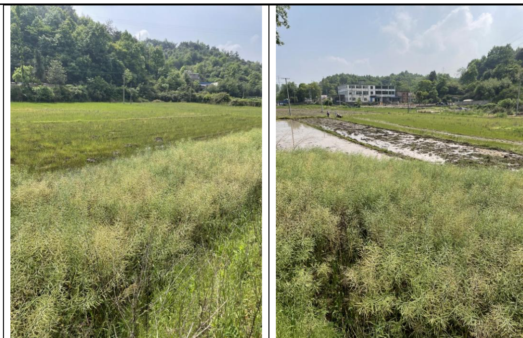
图 3-1 农田生态系统