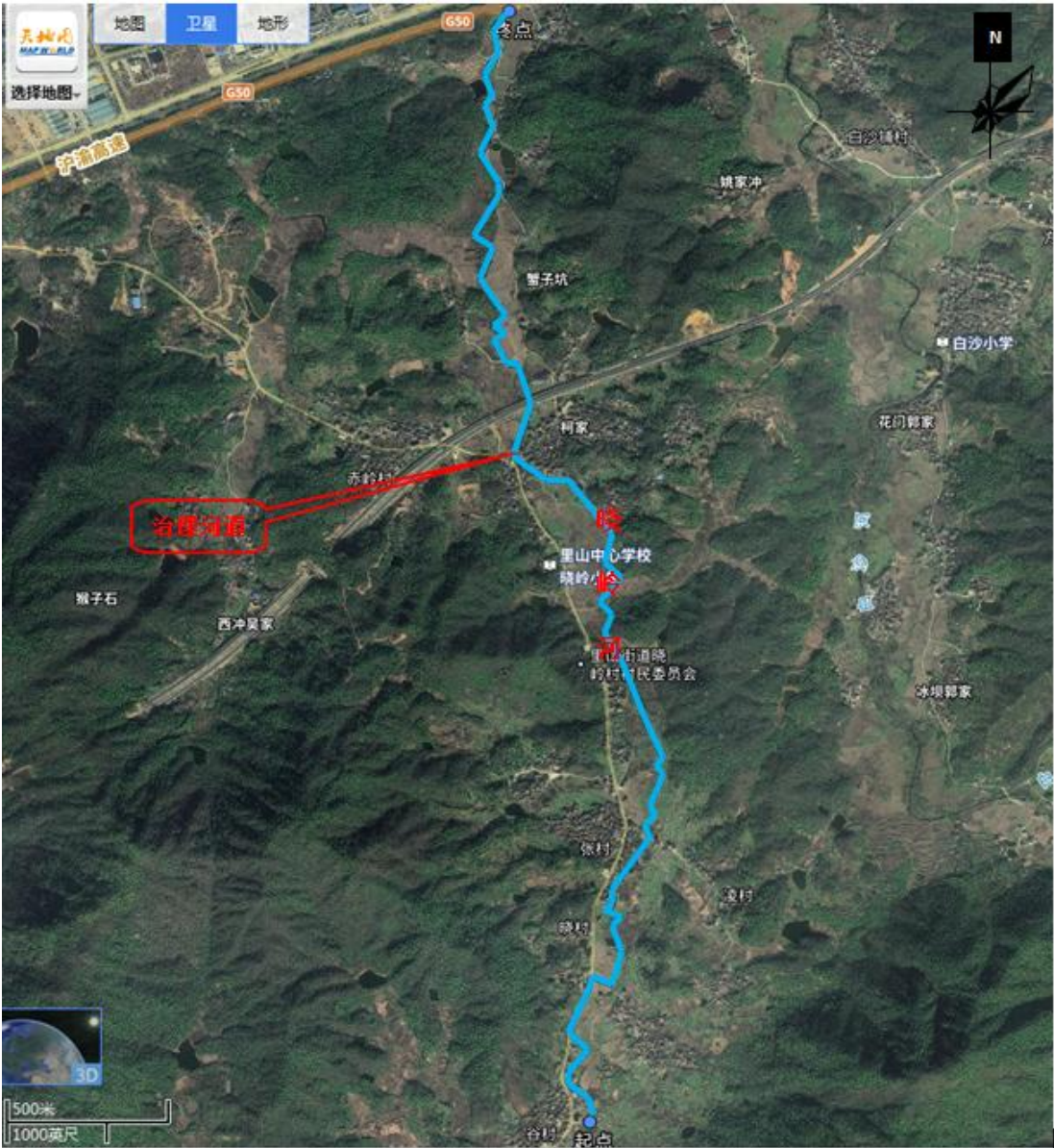
图 2-1 项目地理位置图