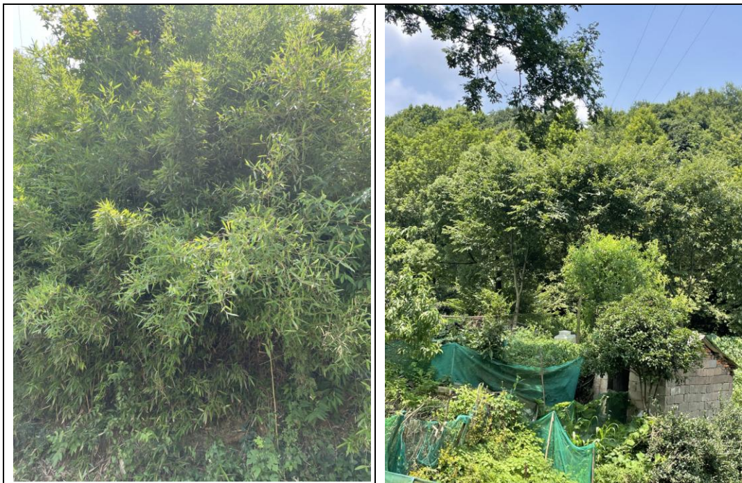
图 3-3 森林生态系统

林分郁闭度较高，群落结构完整。区域森林生态系统斑块分散破碎，森林覆盖率总体偏低，对其发挥正常的生态功能有一定影响。