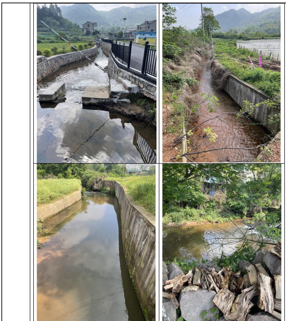
图 3-2 湿地生态系统