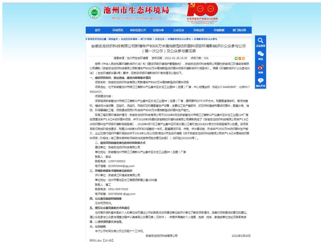
图 2-1 第一次公示截图