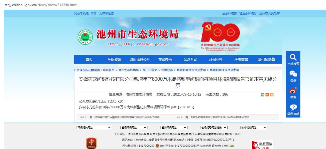
图 3-1 第二次公示截图（网上公示图片）