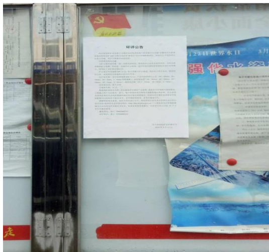
本项目在公示栏张贴公告照片