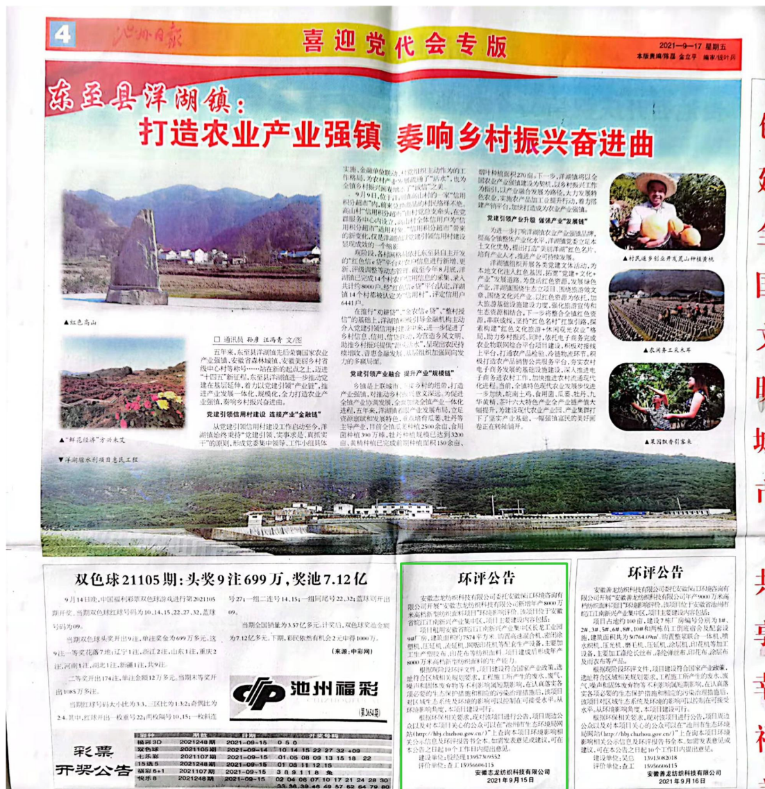
图 3-3 当地报纸公开照片（2021-9-17）